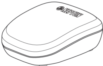
Рис. 1. Внешний вид радиодатчика